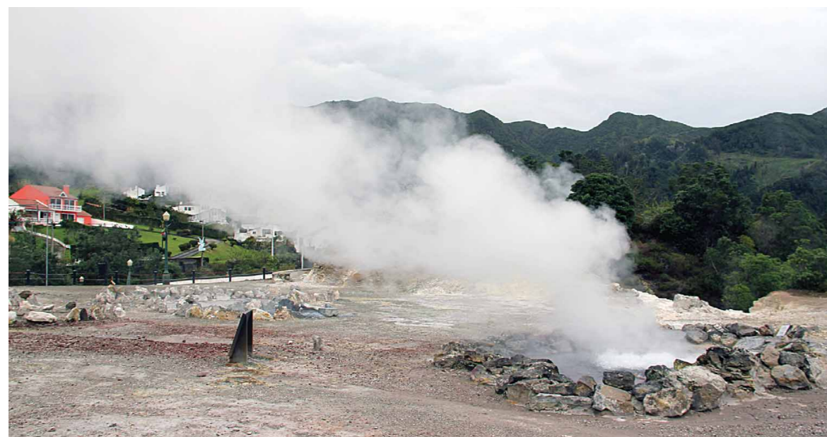
Figura 1 – Fumarola em atividade no campo hidrotermal das Furnas

Num estudo recente, sujeitos humanos voluntários foram expostos durante exercício físico moderado, e por um período de 30 minutos, a níveis de H 2 S abaixo do disposto na legislação dos EUA (14 mg/m 3 ). Foram observadas alterações no sangue e nos músculos, mas nenhum voluntário apresentou sintomas adversos, nem foram registadas alte-